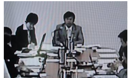
決算特別委員会の模様