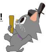
市会マスコットキャラクター またぎち