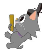
市会マスコットキャラクター またきち